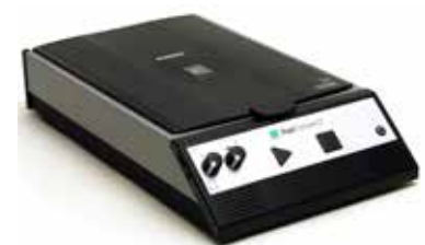
Poet Compact 2 / 2+