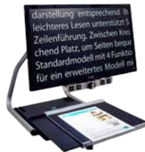
VISIO 22 / 22+