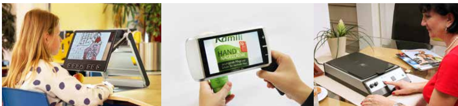
Elektronische Lupen, Bildschirmlesegeräte, Lesekameras und Vorlesegeräte.

Wir bieten eine große Auswahl an passenden Hilfsmitteln, wenn die Brille nicht mehr reicht. Unsere Palette ist so breit wie die individuellen Bedürfnisse unserer Kunden. Die Auswahl der richtigen Sehhilfe ist auf jeden Fall ein großer Schritt hin zu mehr Lebensqualität.